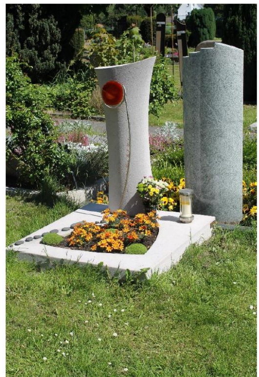
Beispiel: Friedhof Rupelrath